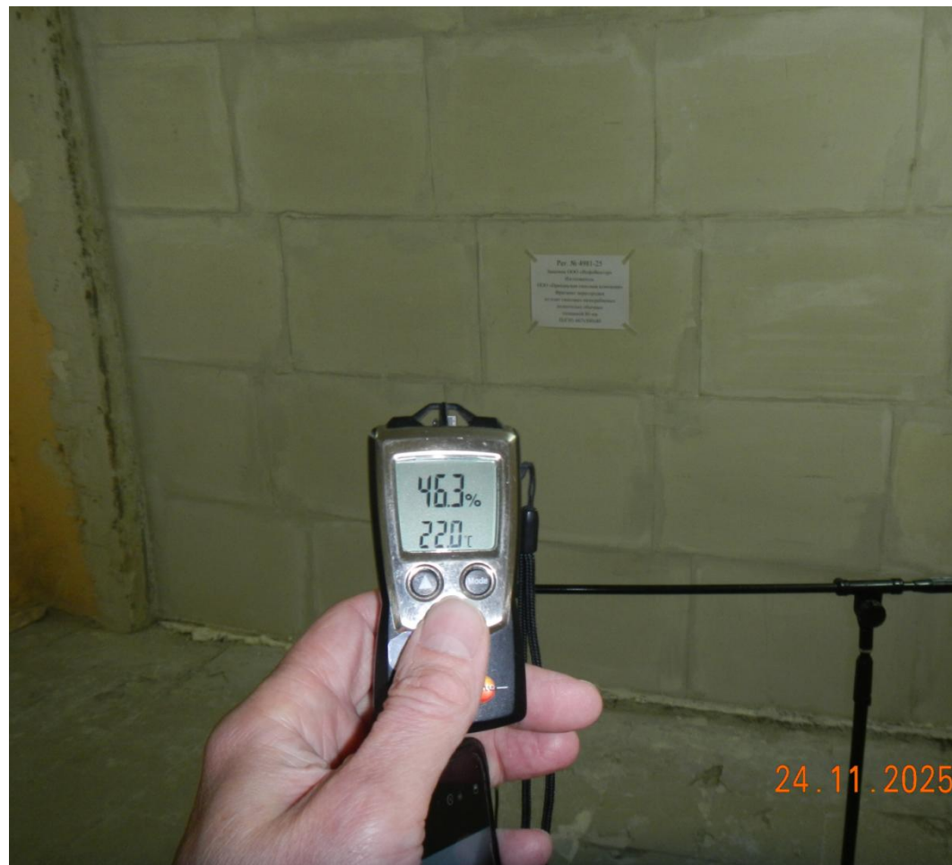
Фото 5. Испытания проводили при температуре окружающего воздуха 22,0°C и средней влажности 46,3 %