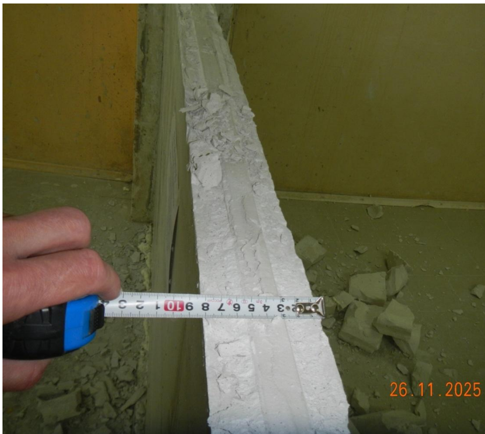
Фото 3. Толщина перегородки 80 мм. Регистрационный № 4981-25 в акустической камере