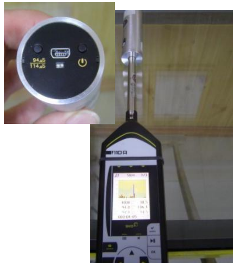
Фото 4. Калибровка шумомера при помощи калибратора акустического типа АК-1000