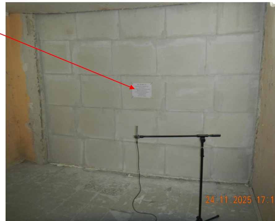
Фото 2. Камера низкого уровня, испытание фрагмента перегородки регистрационный № 4981-25