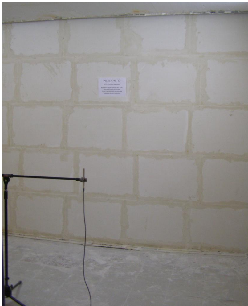
Фото 3. Камера низк. уровня, (испытание перегородки рег. № 4749-22 в акустической камере)

Рег.№ 4749 -22 ООО «Голден Импорт» Фрагмент перегородки из плит гипсовых пазогребневых ПлГН2 667х500х80 пустотелых (камера высокого уровня)