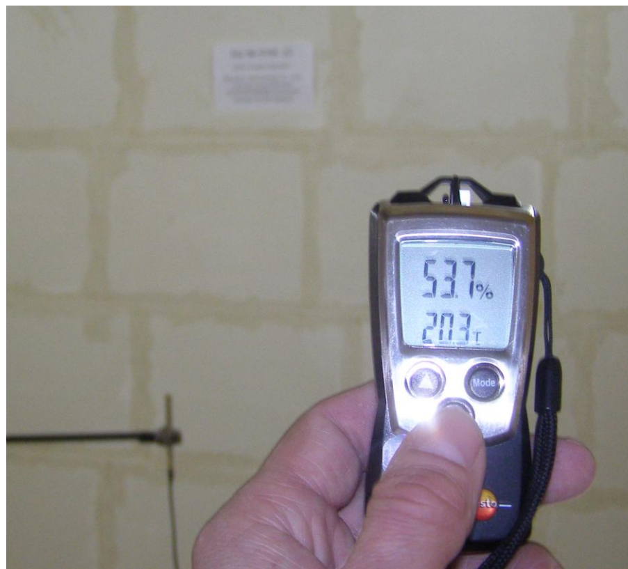
Фото 5. Испытания проводили при температуре окружающего воздуха 20,3°C и средней влажности 53,7 %, (испытание перегородки регистрационный № 4749-22 в акустической камере)