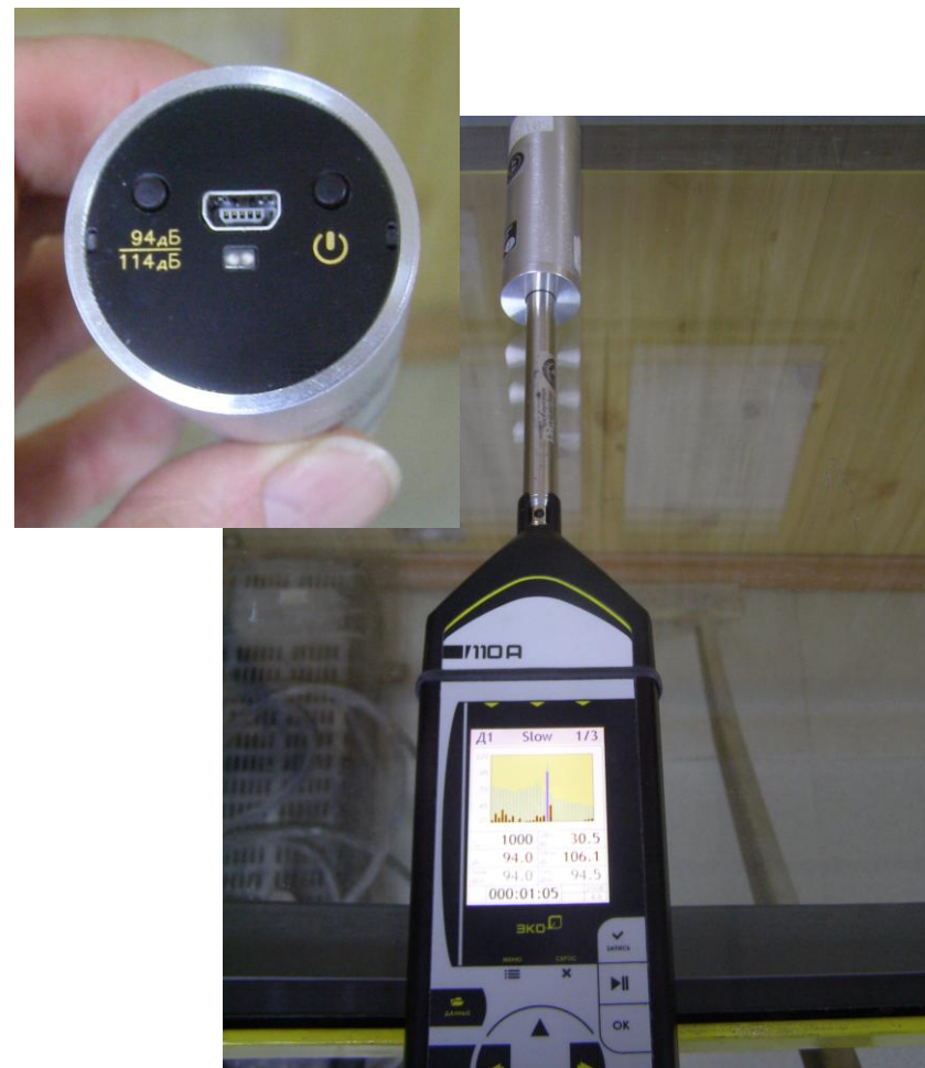
Фото 2. Калибровка шумомера при помощи калибратора акустического типа АК-1000