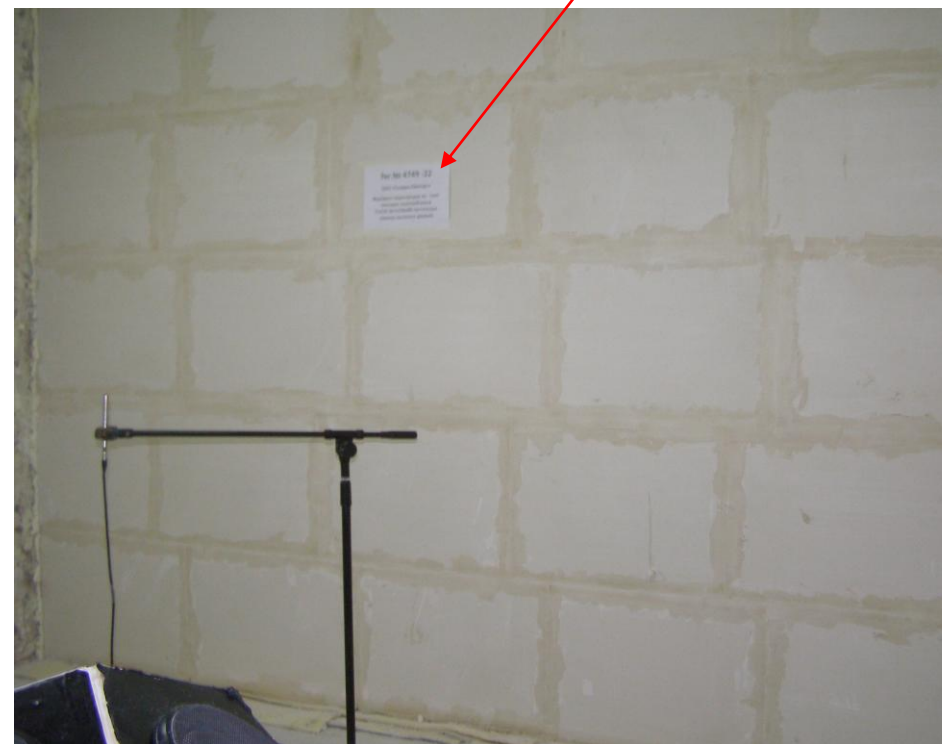
Фото 4. Камера высок. уровня, (испытание перегородки рег. № 4749-22 в акустической камере)

Рег.№ 4749 -22 ООО «Голден Импорт» Фрагмент перегородки из плит гипсовых пазогребневых ПлГН2 667х500х80 пустотелых (камера высокого уровня)