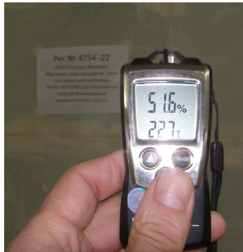
Фото 2. Испытания проводили при температуре окружающего воздуха 22,7°C и средней влажности 51,6 %, (испытание перегородки регистрационный № 4754-22 в акустической камере)