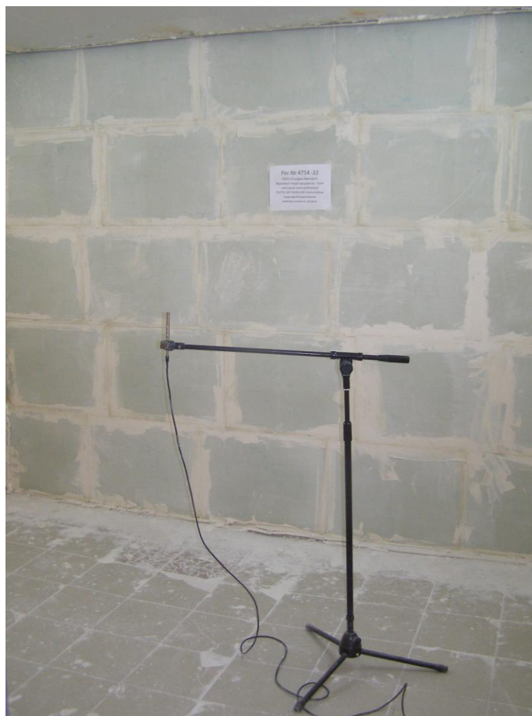
Фото 3. Камера низк. уровня, (испытание перегородки рег. № 4754-22 в акустической камере)