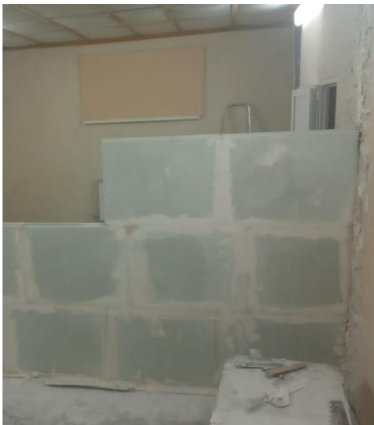
Фото 1. Изготовление фрагмента перегородки в акустической камере, (плиты гипсовые пазогребневые полнотелые гидрофобизированные ПЛГН1 размером 667x500x100)