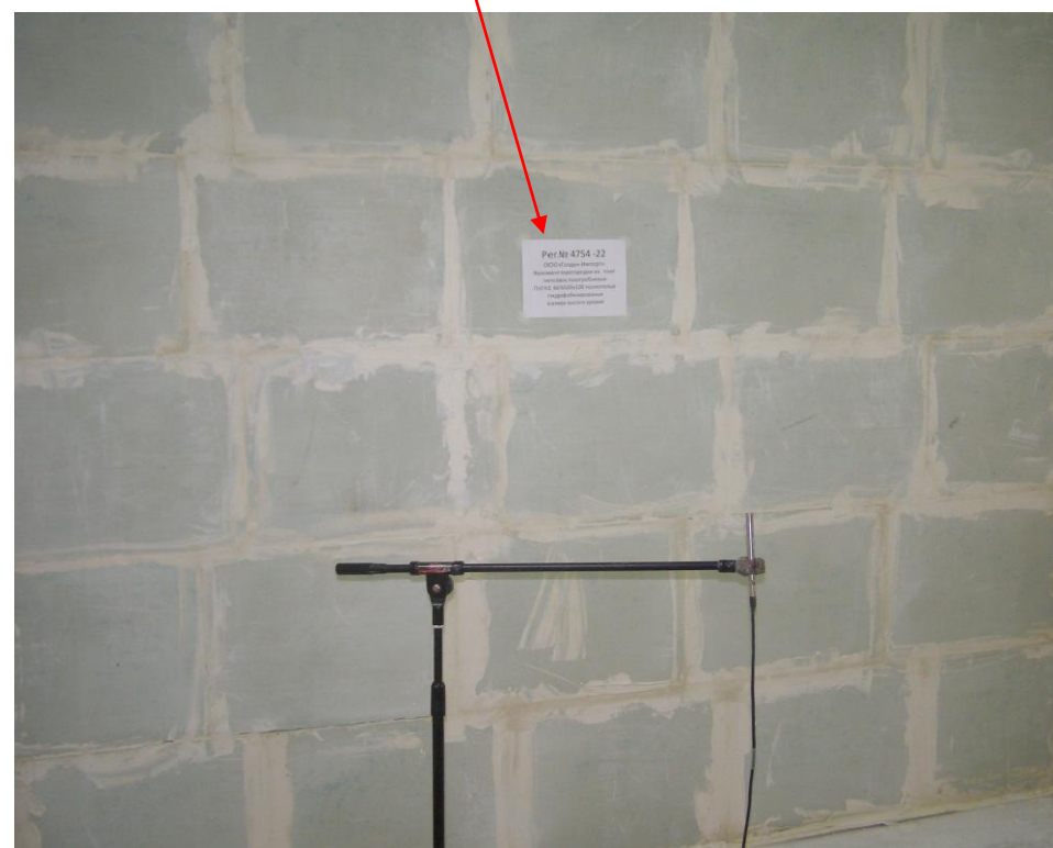
Фото 4. Камера высок. уровня, (испытание перегородки рег. № 4754-22 в акустической камере)